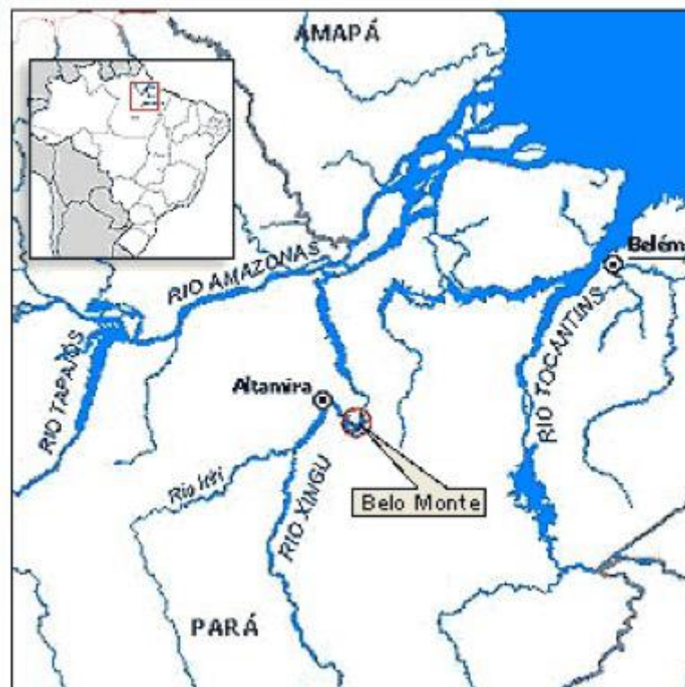
Figura 2 – Localização do Rio Xingu e da Hidrelétrica Belo Monte, cachoeiras da Volta Grande do Xingu.